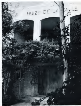
HIJZE DE LA SALLE: het bolwerk van de S.K.O.A.

volkingsregister van Aruba ingeschreven moet zijn, worden ook hier geen andere eisen gesteld. In tegenstelling tot de SKOA heeft de SPCOA wel voorzieningen getroffen voor de aanstelling van ondermeer een directeur-administrateur, die de leiding heeft van het bureau van de Stichting, en van wie de arbeidsvoorwaarden worden vastgelegd bij schriftelijke arbeidsovereenkomst. Op zich is dit een goede constructie. Wel moet een vraagteken geplaatst worden als men weet dat deze functie toebedeeld is aan een reeds bij de Stichting in dienst zijnde onderwijsfunctionaris. In casu is het direktieerschap van een MAVO-school en de functie van directeur-administrateur verenigd in één en dezelfde persoon. Dit nu is een onverenigbaarheid van de bovenste plank. Hoe kan een directeur van een school, die immers met zijn leraren een onderwijstaam behoort te vormen, daarnaast een zo grote invloed uitoefenen op de rechtspositie van diezelfde leraren. Dit mag niet gebeuren! Of de betreffende directeur beperkt zich tot zijn werk op school of hij verrikt slechts als fulltime de buroerwerkzaamheden van de Stichting.